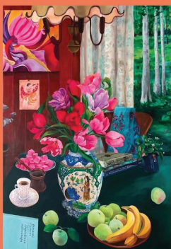
Земляничная поляна Живопись, графика

Во время проведения конференции участникам и гостям будет доступна для свободного посещения выставка Марии Львовой «Земляничная поляна» в Восточном культурном центре ИВ РАН (1 этаж)